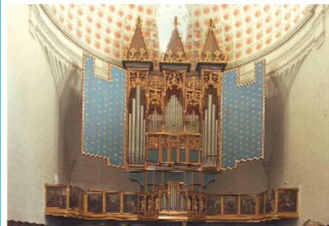
Orgue gothique de la collégiale Santa Maria de Naroca (Espagne) (Reconstruction achevée en 2007)

Tel : 00 33 (0)4 90 66 04 16 Fax : 00 33 (0)4 90 66 12 62 e-mail : pascalquoirin@frce.fr site : http://www.atelier-quoirin.com/