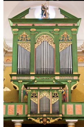
Orgue de l'église de l'Assomption à St-Tropez est sorti en 1991 des ateliers Pascal Quoirin. 3 claviers et pédalier, 28 jeux.